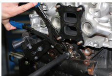
Hose Clip Pliers - for Single/Double Ear Clips | 8261